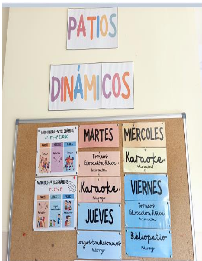
CARTEL EN PLANTA BAJA